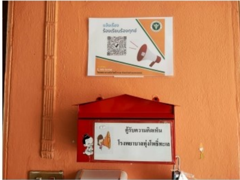
ตู้รับฟังความคิดเห็นบริเวณตึกผู้ป่วยใน