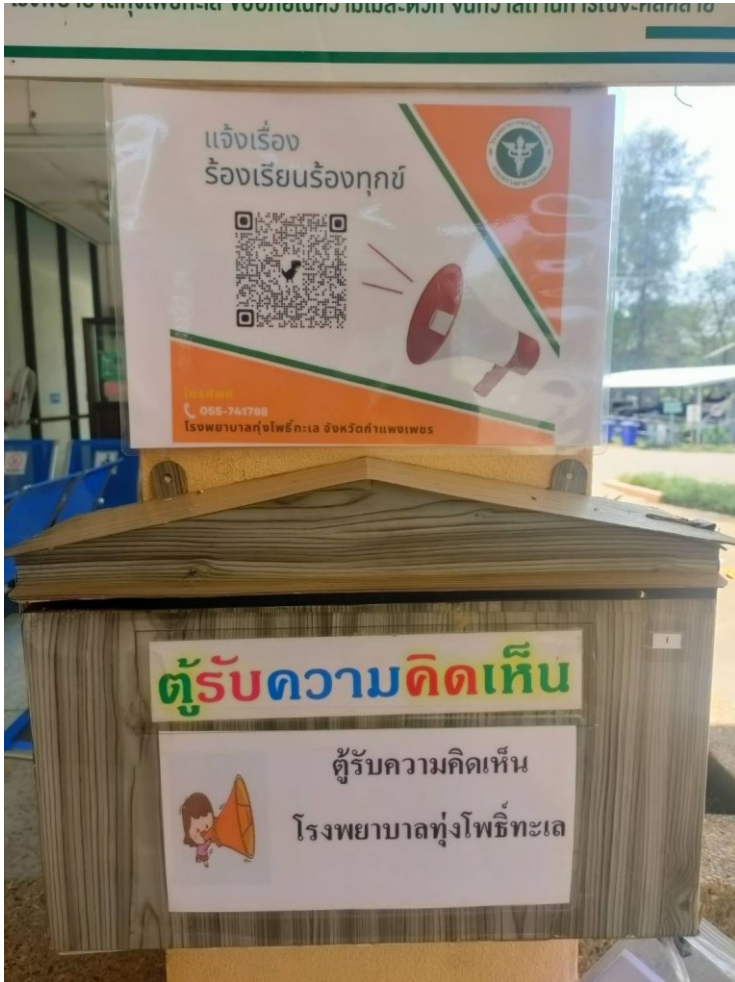
ตู้รับฟังความคิดเห็นบริเวณหน้าห้องบัตร