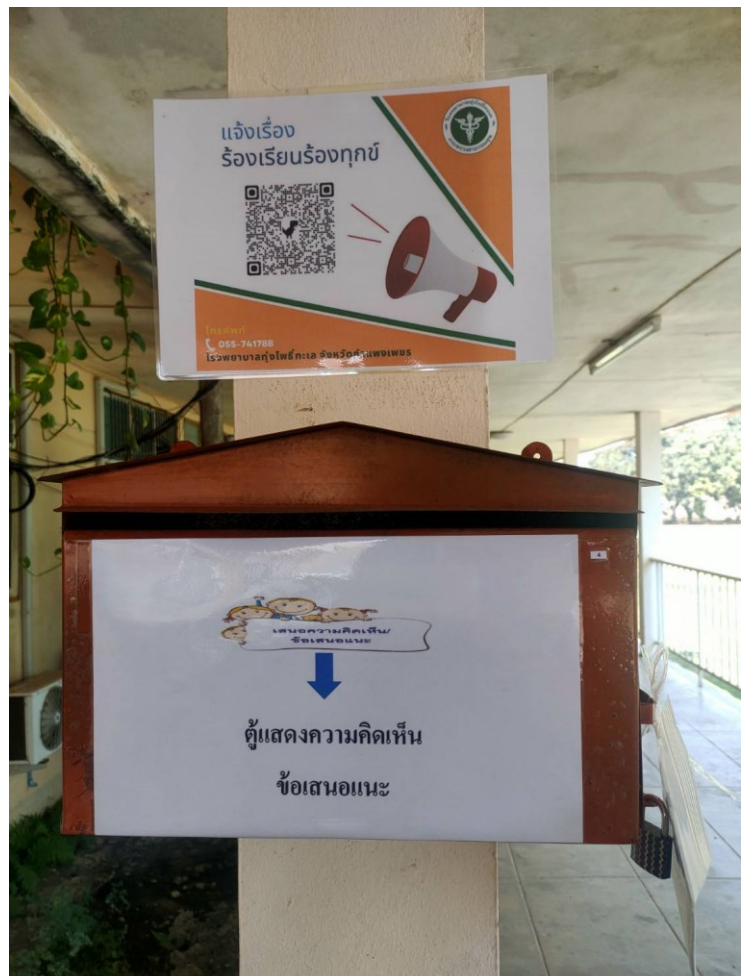
ตู้รับฟังความคิดเห็นบริเวณทางเดิน ระหว่างตึกผู้ป่วยนอกกับตึกผู้ป่วยใน