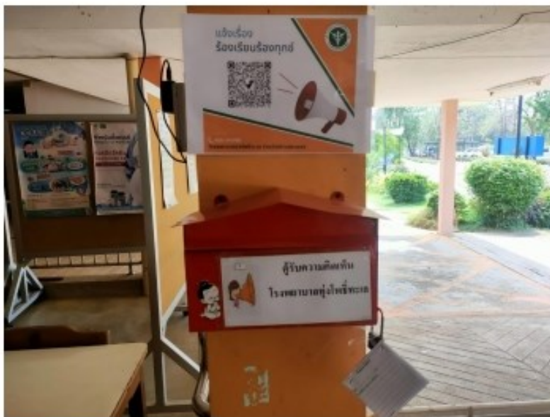
ตู้รับฟังความคิดเห็นบริเวณตึกPCU