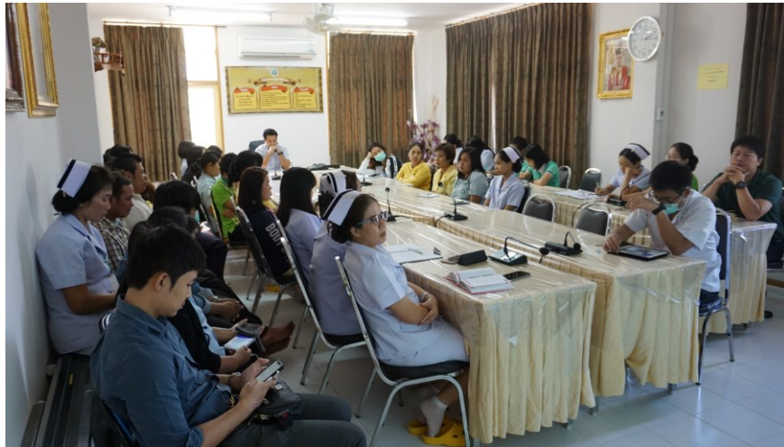
ภาพถ่ายการประชุมเจ้าหน้าที่โรงพยาบาลทุ่งโพธิ์ทะเล ครั้งที่ ๑/๒๕๖๓ เมื่อวันที่ ๒๗ พฤศจิกายน ๒๕๖๒ ณ ห้องประชุมชั้น ๒ โรงพยาบาลทุ่งโพธิ์ทะเล